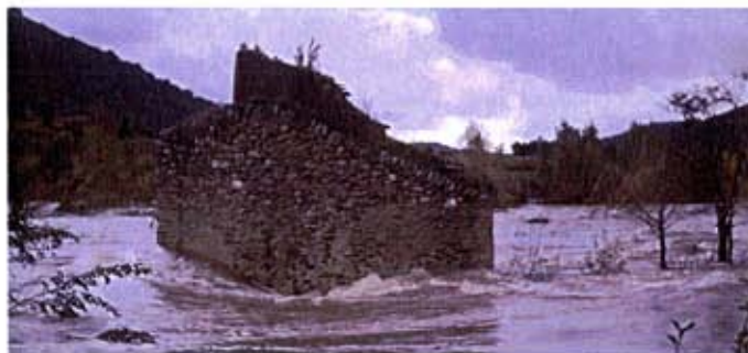
Le moulin de Ceps durant la crue de décembre 1995

Ces crues exceptionnelles peuvent se reproduire et chacun doit mettre en place à son niveau, tous les moyens pour limiter les impacts de tels événements. Des consignes simples peuvent être adoptées pour se protéger soi, ainsi que sa famille et ne pas gêner l'intervention des secours. Ces consignes sont détaillées dans les pages suivantes.